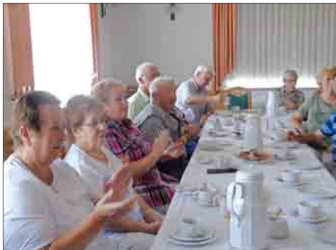
Blick in die Runde der Jubilare