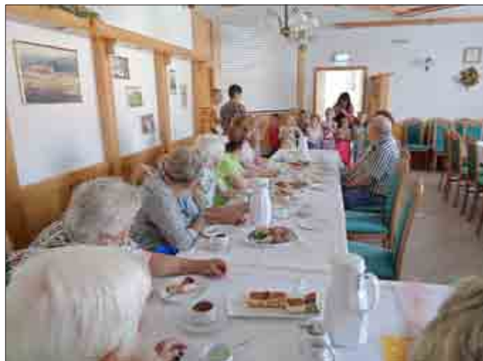
Während des Vortrages der Kindertagesstätte

Dabei wurden viele Themen angesprochen, die die älteren Bürger bewegen und die auch einmal in den gemeindlichen und örtlichen Gremien angesprochen werden sollten.