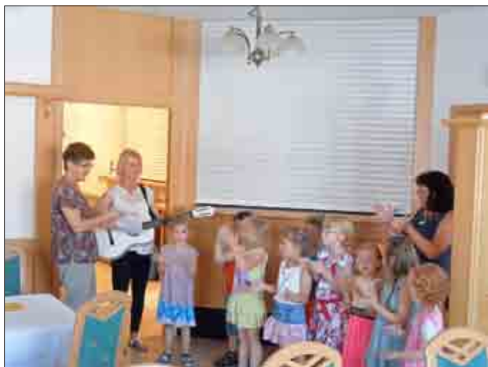
Die Abordnung der Kindertagesstätte bei ihrer Programmdarbietung

Nachdem die diesjährigen Schulanfänger den Zuckertütenbaum ordentlich gegessen haben, erwarten alle das lang ersehnte Zuckertütenfest.