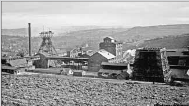
Das Werk Sachsen-Weimar mit dem ersten eisernen Fördergerüst. Blick vom Kornberg auf das Werk - etwa 1936.