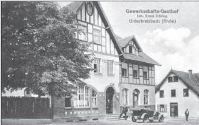
Eine alte Ansichtskarte des ehemaligen Gewerkschaftsgasthofes „Schlägel und Eisen“ in der Schachtstraße