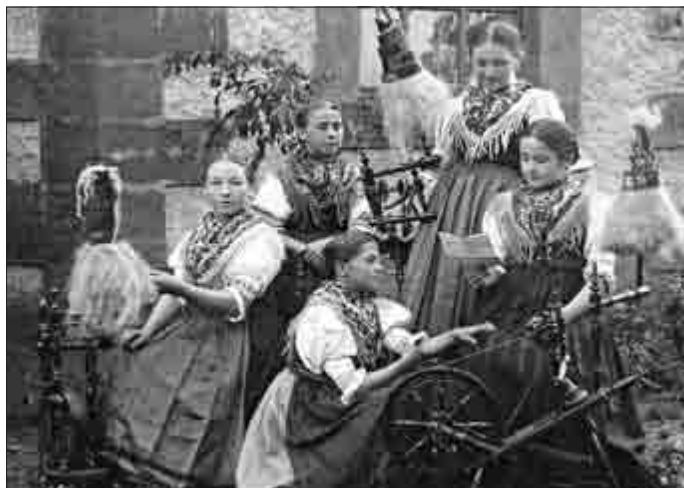
Eine Trachtengruppe beim Flachs spinnen, um 1930

Bei Bedarf kann nach telefonischer Rücksprache ein weiterer Termin zur Besichtigung vereinbart werden (z.B. aus Anlass von Klassentreffen etc.). (Telefon: Herr Augsten 036962/20297 oder Herr Jünger 036962/20231)