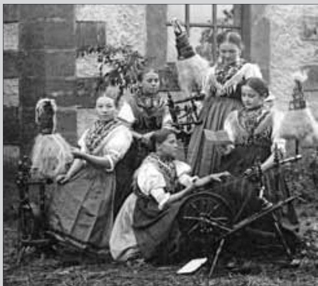
Eine Trachtengruppe beim Flachs spinnen, um 1930

Bei Bedarf kann nach telefonischer Rücksprache ein weiterer Termin zur Besichtigung vereinbart werden (z.B. aus Anlass von Klassentreffen etc.). (Telefon: Herr Augsten 036962/20297 oder Herr Jünger 036962/20231)